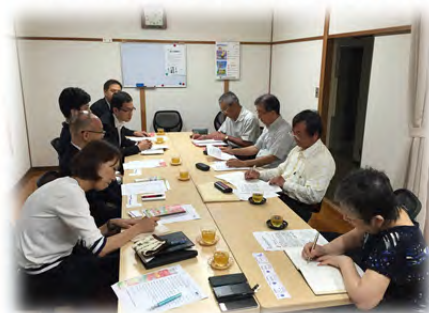
《 淀学区 》