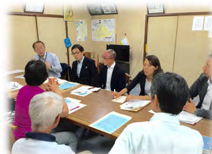
《 納所学区 》