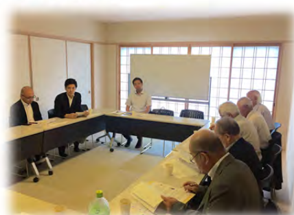
《 淀南学区 》